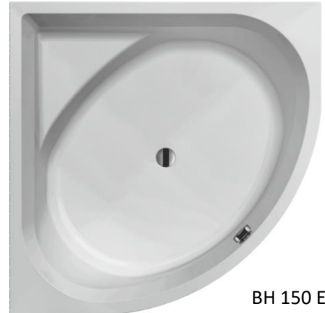
BH 150 E