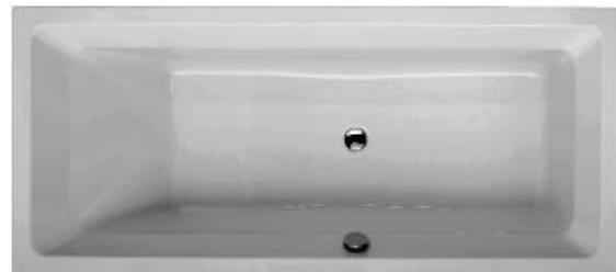
BH 180 (Überlauf in Sitzrichtung rechts)

Hergestellt im Vakuum – Tiefziehverfahren auf Aluminium-Werkzeugen. Verstärkung mit glasfaserverstärktem Kunststoff. Herstellung nach DIN EN 198 und DIN EN 14516. Einlaminiertes Bodenbrett der Stärke 12 mm zur Aufnahme des Fußsystems. Montage mit Badewannenfüßen (siehe Zubehör) o.a. geeignete/zugelassene Montagesysteme. Bodenablauf Mitte. Überlauf wahlweise in Sitzrichtung rechts oder links Ab- und Überlaufgarnitur mit Bowdenzug 800 mm Optional mit Pool-, Licht- und Soundsystemen. Optional mit SLIM Rand. Lieferbar in den Farben: weiß