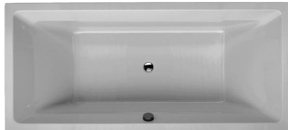
BH 200 Duo

Hergestellt im Vakuum – Tiefziehverfahren auf Aluminium-Werkzeugen. Verstärkung mit glasfaserverstärktem Kunststoff. Herstellung nach DIN EN 198 und DIN EN 14516. Einlaminiertes Bodenbrett der Stärke 12 mm zur Aufnahme des Fußsystems. Montage mit Badewannenfüßen (siehe Zubehör) o.a. geeignete/zugelassene Montagesysteme. Bodenablauf Mitte. Überlauf Mitte vorn Ab- und Überlaufgarnitur mit Bowdenzug 800 mm Optional mit Pool-, Licht- und Soundsystemen. Optional mit SLIM Rand. Lieferbar in den Farben: weiß