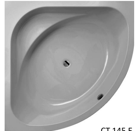
CT 145 E