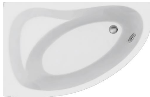
DE 145 U links