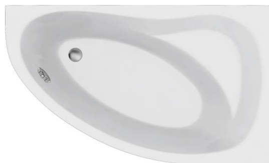
DE 160 U rechts