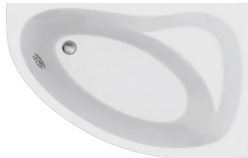
DE 145 U rechts