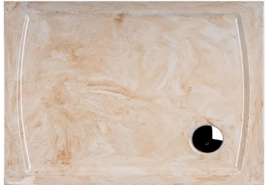
Beispielabb.: TWO 120/90 Travertin fein

Hergestellt im Vakuum – Tiefziehverfahren auf Aluminium-Werkzeugen. Verstärkung mit glasfaserverstärktem Kunststoff. Herstellung nach DIN EN 198.