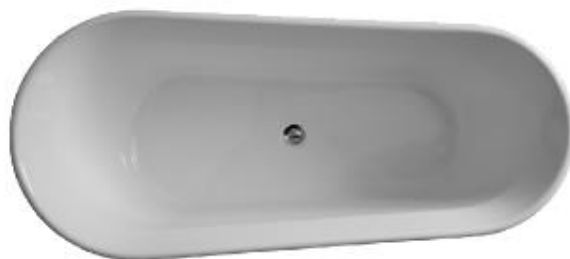
ON 1760/800 M