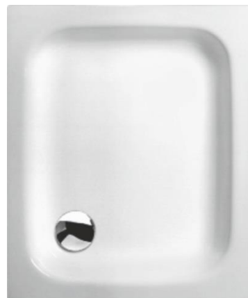
SE 90/75 FL