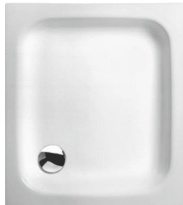
SE 90/80 FL

Einlaminiertes Bodenbrett der Stärke 12 mm zur Aufnahme des Fußsystems. Montage mit Wannenträger oder Fußsystem (siehe Zubehör), o.a. geeignete/zugelassene Montagesysteme.