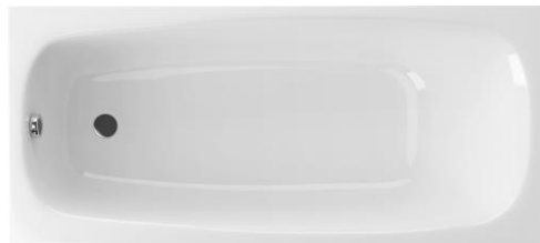
SE 170/75 L