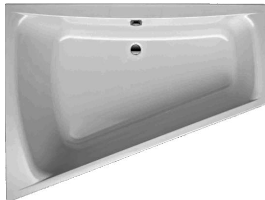
SF 170 U links (Überlauf in Sitzrichtung links)