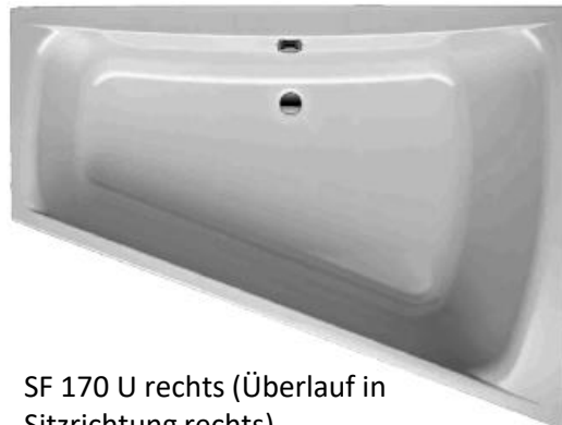
SF 170 U rechts (Überlauf in Sitzrichtung rechts)