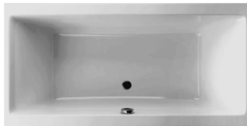
SN 150/75 Duo