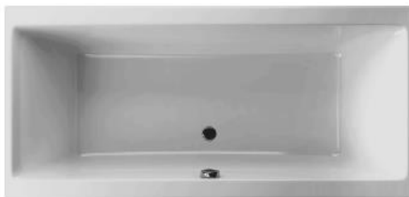
SN 190/90 Duo