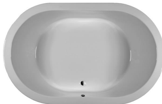
ST 190/120 O