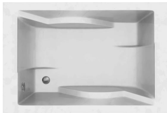
ST 180/120 Duo