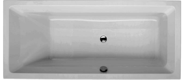
BH 170 (Abb. Überlauf rechts)

Art. - Nr.: 060BWN0301L (Überlauf links) Art. - Nr.: 060BWN0301R (Überlauf rechts) Maße: 1700 x 750 x 440 mm (L x B x H) Inhalt: ca. 220 l abzgl. Person (en)