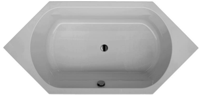
BH 190 S (Abb. Überlauf rechts)

Art. - Nr.: 102BWS0301L (Überlauf links) Art. - Nr.: 102BWS0301R (Überlauf rechts) Maße: 1900 x 900 x 450 mm (L x B x H) Inhalt: ca. 320 l abzgl. Person (en)