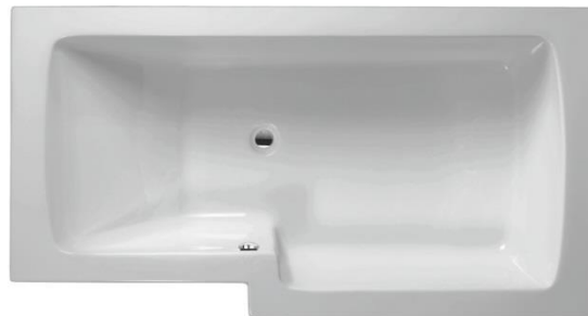
CT 160 K rechts

Lieferbar in den Farben: weiß Andere Farben auf Anfrage